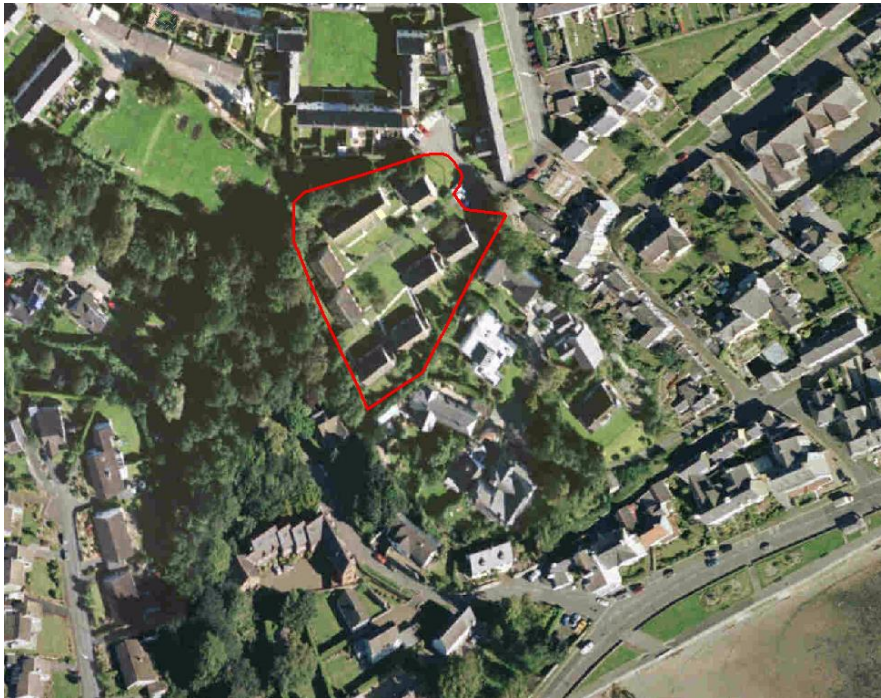
Figure 4 - Bryn Tirion, Beaumaris

Description – Bryn Tirion is a small cul-de-sac of local authority sheltered bungalows and extends to some 0.92 hectares (2.27 acres). The site is located in an established residential area however roadways are narrow and parking is at a premium. All of the properties are occupied on secured tenancy agreements therefore the properties are not readily available for development.