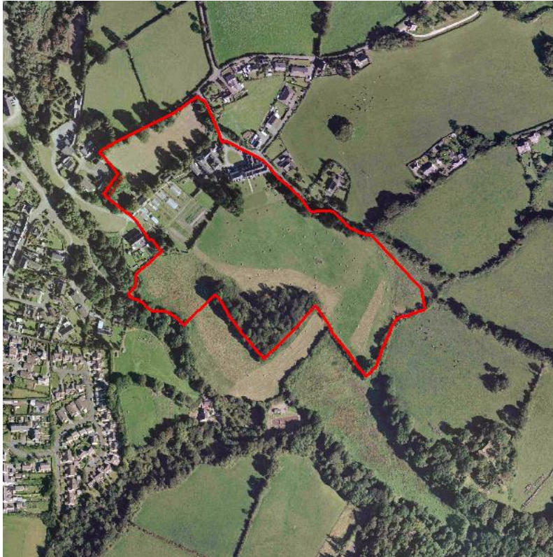
Figure 6 - Haulfre, LLangoed

Description – A Local Authority owned care home facility with grounds extending to approximately 8.41 hectares (20.79 acres).