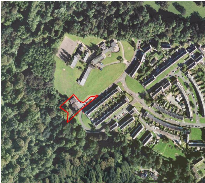
Figure 3 - Beaumaris Day Care Centre

Description – Property known as the Beaumaris Day Care centre which adjoins the Beaumaris School playing fields. The site extends to approximately 0.16 hectares (0.41 acres) with the building extending to approximately 215 m 2 . The property adjoins the neighbouring Beaumaris School playing field providing scope to extend the site area to accommodate larger development.