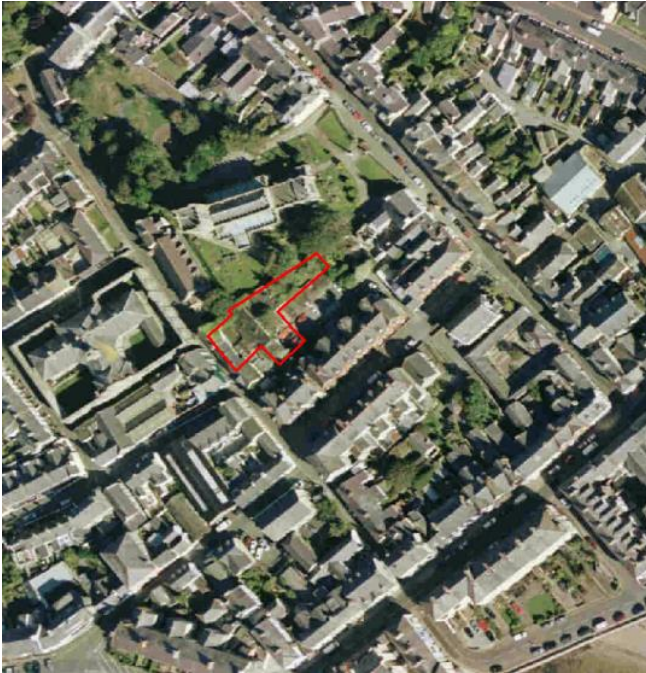
Figure 7 - Social Club, Beaumaris

Description – A privately owned former social club located close to the Beaumaris Town Centre. 0.07 Hectares 0.237 acres. The site comprises 2 mid terraced properties together with a former social club building to the rear. Access is problematic due to the nature of the roads and privately owned garages to the rear of the property. Space is also limited and the site is adjacent to the Church.