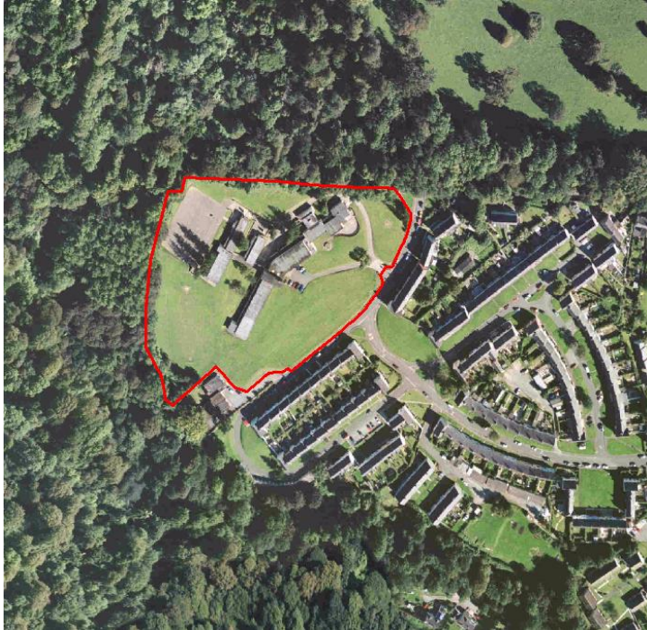
Figure 2 – Beaumaris Primary School

Description – The site extends to approximately 2.07 hectares (5.13 acres) which has been partially developed to provide a two-storey school building extending to approximately 2025m 2 together with playing fields. The site is already within the ownership of Anglesey County Council and may be available in a reasonable period. The entire site is located within development boundaries however the school building is Grade II listed and cannot be demolished.