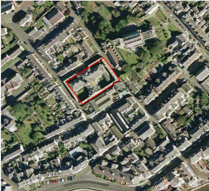
Figure 5 - Gaol, Beaumaris

Description – Historic Grade I listed former prison located close to the centre of Beaumaris. The site extends to approximately 0.17 hectares 0.42 acres and has been fully developed. Roads leading to the property are extremely narrow with a general lack of footways.