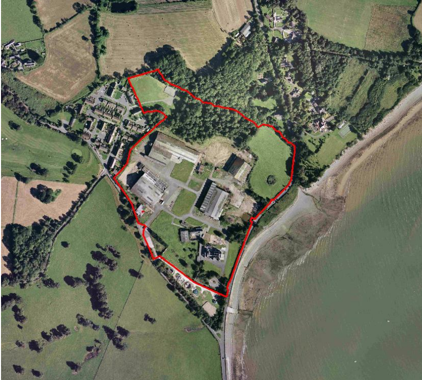
Figure 8 – Seiriol – Leirds, Llanfaes

Description – A privately owned site extending to approximately 5.96 Hectares (14.73 Acres). There are a number of industrial buildings on site which would require demolition and it is quite likely the ground is contaminated in part.